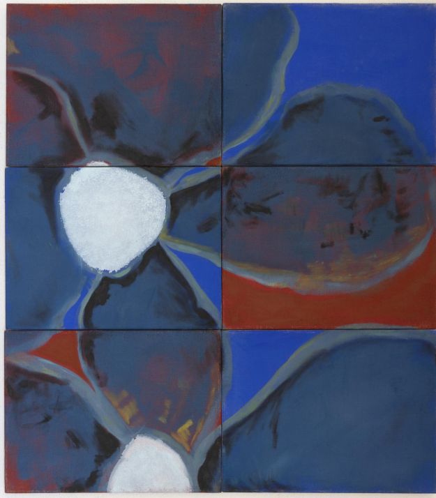
"Red & blue" av Finn Anton Örstrand. Bild: Finn Anton Örstrand