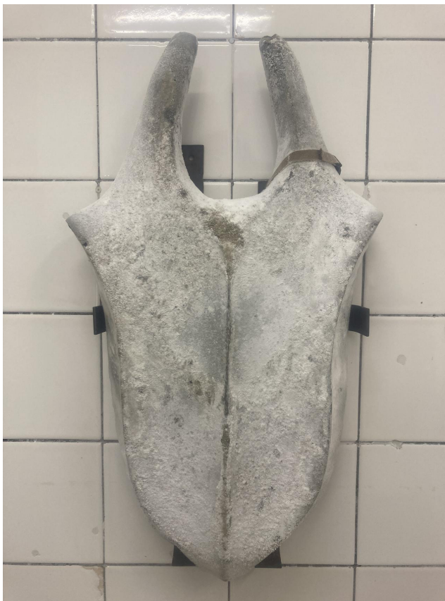
"Soaper", skulptur av Therese Bülow.

"Static object", grupputställning, Obra, Bantorget 4, Lund, t o m 9/12.