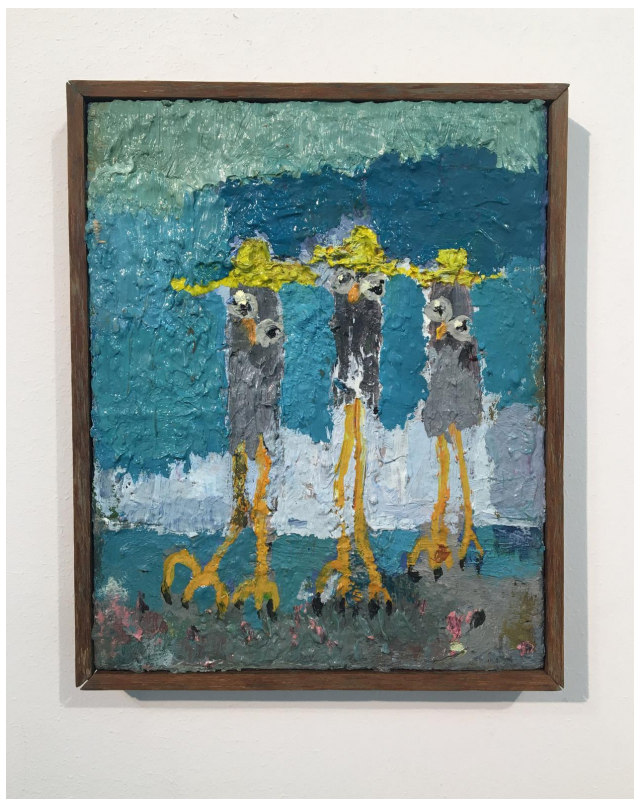
”Van Goghs flygskola” av Björn Kjelltoft. Bild: Björn Kjelltoft