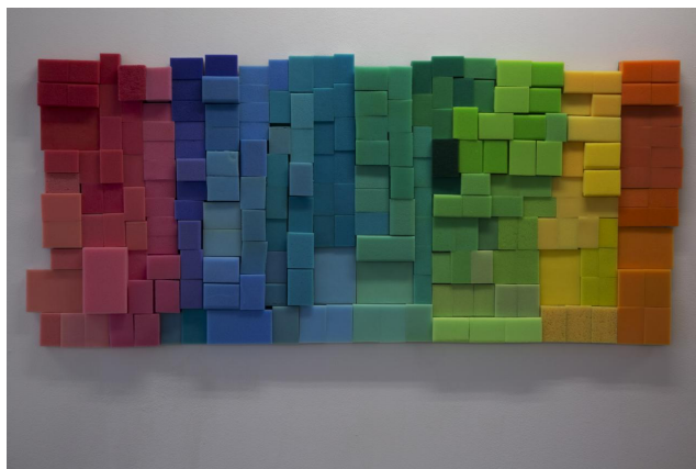
Helena Olssons "Den mjuka omsorgens färgskala". Bild: Helena Olsson

"Grid for smoothness", Therese Bülow, Galleri CC, Båstadsgatan 4, Malmö, t o m 10/12.