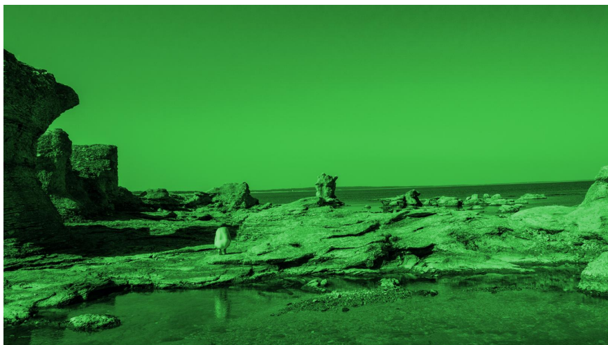
Dana Sederowskys "Fårö #1", 2023.